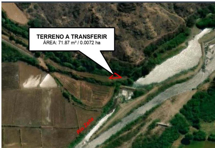
Foto satelital Google Earth